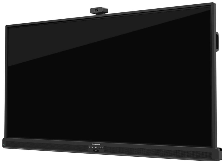
Neu: digitales, interaktives Display – «eWandtafel»

Die Anschaffung der digitalen Displays ermöglicht die Förderung moderner Unterrichtsformen, die Integration digitaler Lehrmittel und unterstützt hybride Unterrichtsformen.